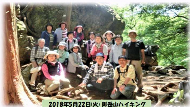
2018年5月22日(火) 御岳山ハイキング