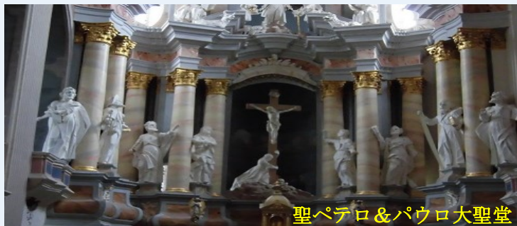
聖ペテロ&パウロ大聖堂