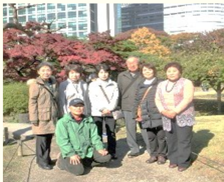
2017年・築地市場・場外散策