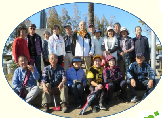
11月 グランドゴルフクラブ 例会