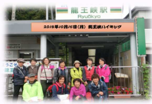
2018年10月15日(月) 龍王峡ハイキング