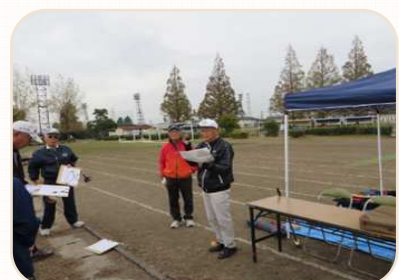
11月22日 班対抗Gゴルフ大会