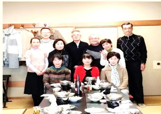
新年会「やまや」全員集合

今年度のスタートは4月12日・13日に霧降高原・日光東照宮へ一泊二日の旅行、お風呂に入る前に時間があり、全員で懐かしい「ピンポン」を楽しみ、メインの宴会・カラオケタイムでは毎回全員が我を忘れて盛り上がり昼間とは別人になります（7名が参加）