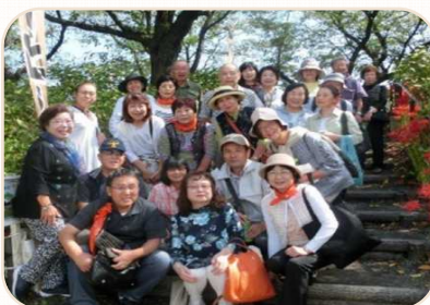
9月19日 曼殊沙華花見会