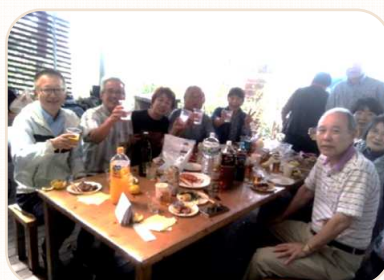
10月3日 清水公園BBQ大会